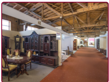
Współczesne wnętrze pawilonu