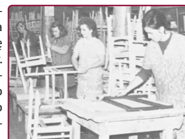
Swarzędzkie Fabryki Mebli

ogródki działkowe i hotel robotniczy. W fabryce działała Ochotnicza Straż Pożarna i wydawano gazetę zakładową „Segmenty”. W 1990 r. przedsiębiorstwo objęto pilotażową prywatyzacją, a rok później jako jedno z pierwszych zadebiutowało na giełdzie. Firma zakończyła działalność w roku 2011.