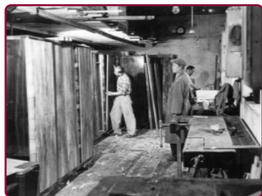
Zakład stolarski (lata 50. XX w.)

Swarzędzkie meble w Nowym Jorku (1938 r.):