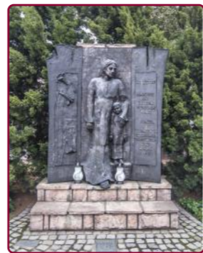
Swarzędzki święty Józef