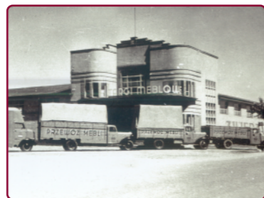
Pawilon meblowy (1938 r.)