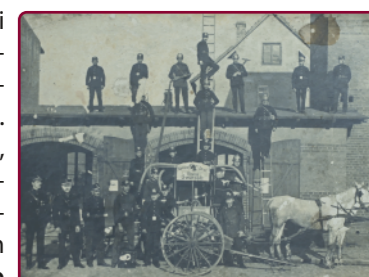
Swarzędzcy strażacy przed remizą (początek XX w.)

Swarzędzkie Centrum Historii i Sztuki powstało w budynku dawnej remizy strażackiej, przystosowanym do celów muzealnych. W środku znalazła się ekspozycja, która w nowoczesny sposób prezentuje historię i różnorodność kulturową Swarzędza. Można tam m.in. odbyć wirtualny spacer po dawnym Swarzędzu , odszukać znajome miejsca na makiecie miasta i wcielić się w rolę strażaka. Obiekt oferuje też bogaty program zajęć edukacyjnych (lekcje muzealne, warsztaty, prelekcje).