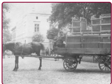
Przewóz mebli, firma Skweres (lata 30. XX w.)

Od początku istnienia Swarzędza, który prawa miejskie uzyskał w 1638 r., rozwijało się rzemiosło, a miasto przez pewien czas było znaczącym ośrodkiem włókienniczym. W drugiej połowie XIX w. rozpoczyna się dobra koniunktura dla swarzędzkich stolarzy. Prawdziwą rewolucją w tej branży było wprowadzenie w 1890 r. mechanicznej obróbki drewna . Początkowo produkowano głównie na rynki lokalne, z czasem meble ze Swarzędza zaczęły trafiać do salonów w Polsce i w Niemczech. Wraz z sukcesami zwiększała się liczba stolarzy: w pierwszym dziesięcioleciu XX w. w Swarzędzu funkcjonowało 30 warsztatów, a po odzyskaniu niepodległości działało już 70 mistrzów, a oprócz tradycyjnych warsztatów pojawiły się też większe zakłady. Niezwykle ważną rolę w rozwoju swarzędzkiego rzemiosła odegrał miejscowy cech stolarski .