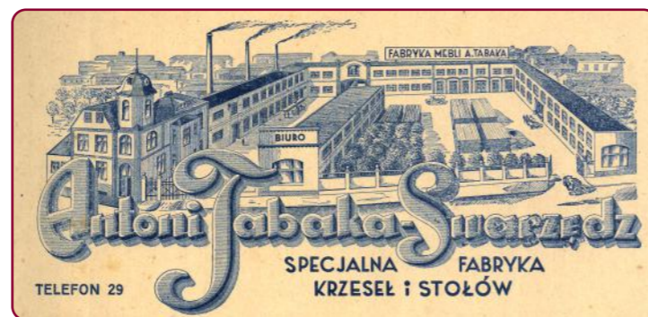
Rycina z katalogu fabryki Antoniego Tabaki (lata 30. XX w.)