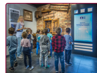
Zwiedzający w Strefie Stolarza

Centrum stanowi integralną część Swarzędzkiego Szlaku Meblowego, prezentując wielowiekową tradycję sztuki stolarskiej w mieście. Do dyspozycji zwiedzających pozostaje kilkustanowiskowa Strefa Stolarza . W jej części multimedialnej można zbudować wirtualny mebel i poznać nazwy (także gwarowe) narzędzi stolarskich. Druga część to historyczna ekspozycja prezentująca warsztat stolarski z pierwszej połowy XX w., katalogi wystawowe z targów meblowych oraz krótki rys historyczny przemysłu stolarskiego w Swarzędzu.