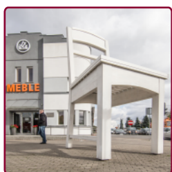
Nowe krzesło XL

W 1995 r. w ramach promocji swarzędzkich mebli przed Salonem Meblowym Stolarzy Swarzędzkich ustawiono gigantyczne krzesło (wysokość 4,60 m, szerokość 1,65 m), wykonane z drewna sosnowego przez Stefana Gajewskiego. W 2011 r. krzesło zostało zastąpione nowym autorstwa Grzegorza Zaremby. Mebel wpisal się w krajobraz miasta jako charakterystyczny punkt orientacyjny.